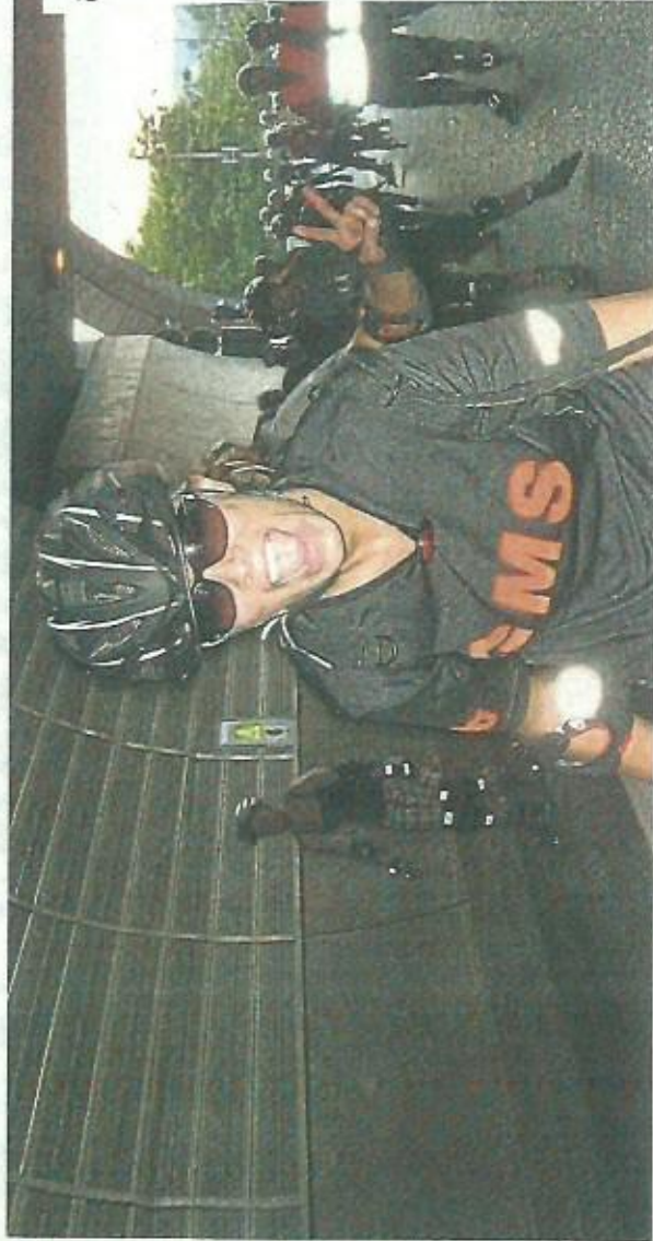
Erst am Moselufer nach Lay, dann via Pfaffendorfer Brücke und Glockenbergtunnel nach Ehrenbreitstein.

Bei der Rhein-Musel-Wasser-Tour geht es zunächst vom Gelände des Sportsors evm im Moselbogen aus an der Mosel entlang bis nach Lay. Dort machen die Skater in Addis Biergarten Pause. Anschließend kehren sie via Saarkreisel in die City zurück, brausen über die Pfaffendorfer Brücke und durch