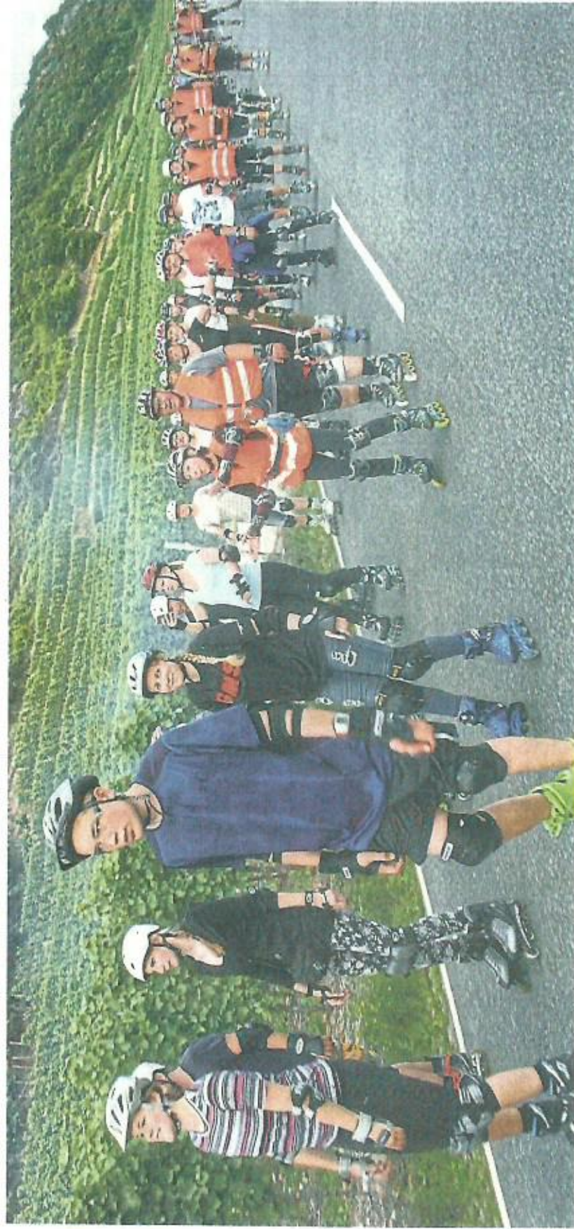
Zwischen Gölser Brücke und Lay hatten die Skater freie Fahrt. Während die einen richtig Gas gaben, glitten die anderen zwischen Reben und Mosel gemütlich dahin.

Wir von hier - ein gutes Stück Heimat extra