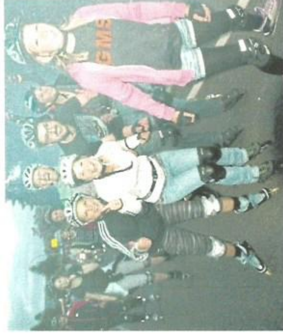
Die Koblenzer Skatenights kommen bei den rollenden Sportlern sehr gut an. Und die Skater fahren in diesem Jahr wieder über die Pfaffenfurter Brücke und durch den Glockenbergstunnel.

Details/Newsletts abo. www.koblenzer-skatenight.de