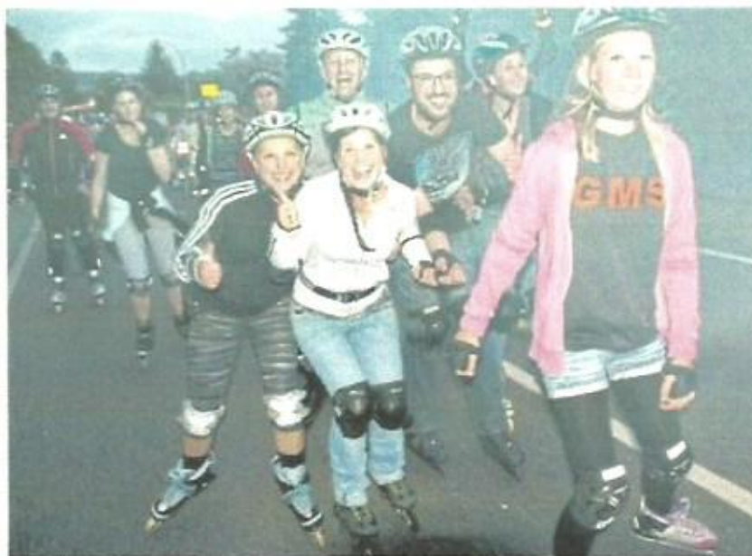
Die Koblenzer Skatenights kommen bei den rollenden Sportlern sehr gut an. Und die Skater fahren in diesem Jahr wieder über die Pfaffendorfer Brücke und durch den Glockenbergtunnel.

Rheindorfer-Finaltour: Donnerstag, 7. September, ab/bis EVM, via Neuendorf und Wailersheim nach Kesselheim, 17 Kilometer, Level: leicht.